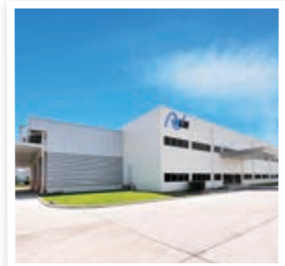
โรงงานที่มอเตนคร

บริษัท นิคเคสยามอลูมิเนียม จำกัด มีโรงงานในประเทศไทยที่ปทุมธานีและมอเตนคร ซึ่งดำเนินธุรกิจต่างๆ เช่น การผลิตและจำหน่ายอะลูมิเนียมแผ่น อะลูมิเนียมฟอยล์ และเครื่องแลกเปลี่ยนความร้อน รวมทั้งการออกแบบ การผลิตและจำหน่ายแผ่นผนังสำหรับห้องแช่เย็นแช่แข็ง สำเร็จรูปที่ใช้ในอุตสาหกรรมและห้องคลินิรุมต่อไปจะเป็นการแนะนำกิจกรรมการรักษาสีงแวดล้อมของบริษัท นิคเคสยามอลูมิเนียม จำกัด บางส่วน