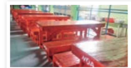
โต๊ะและเก้าอี้ยาวที่ทำขึ้นจากวัสดุเหลือทิ้ง