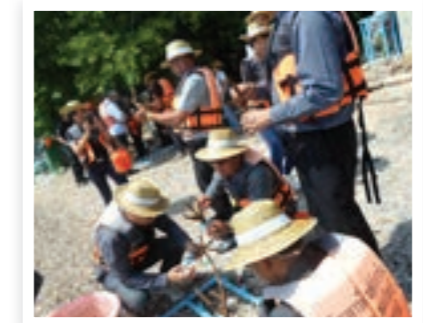
บรรยากาศการปลูกปะการัง