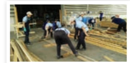
บรรยากาศการทำโต๊ะและเก้าอี้ยาว