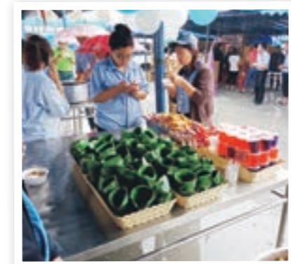
งานที่ทำจากใบตอง

ใบตอง เพื่อสอนให้เด็ก ๆ รับรู้ถึงความสำคัญของสีงแวดล้อม พร้อมทั้งเป็นการเชื่อมสัมพันธ์ระหว่างบริษัทและผู้ที่อยู่อาศัยในบริเวณใกล้เคียง