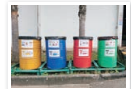
ถังขยะสำหรับแยกขยะ