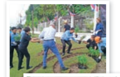
ดอกดาวเรืองที่บานสะพรั่ง