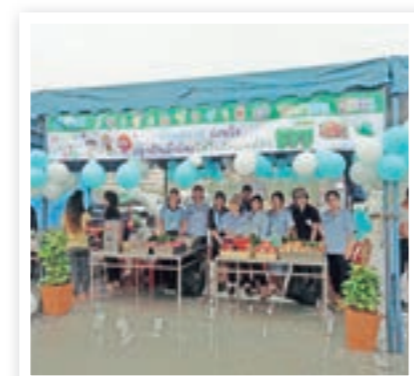
บรรยากาศการออกร้านในวันเด็ก