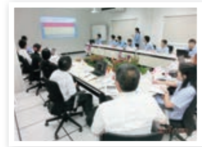
บรรยากาศการประชุมผู้รับผิดชอบและปฏิบัติงานด้านสีงแวดล้อมในประเทศไทย

ในปี 2017 ได้มีการจัดขึ้นในเดือนพฤศจิกายน ในการประชุมผู้รับผิดชอบด้านสีงแวดล้อมจาก 5 ไชต์งาน 3 บริษัทเข้าร่วมประชุมด้วยกัน ในการประชุม เราได้มีการแนะนำกิจกรรมการรักษาสีงแวดล้อมของแต่ละโรงงาน และมีการแบ่งปันข้อมูลเกี่ยวกับกฎหมายด้านสีงแวดล้อมในประเทศไทย เป็นต้น ในครั้งนี้เรายังได้มีการถามตอบและสนทนาเกี่ยวกับกิจกรรมการประหยัดพลังงาน มลพิษทางดินและน้ำบาดาล ซึ่งเป็นประเด็นสำคัญของแต่ละไชต์งานอย่างกระตือรือร้น รวมทั้งมีการนำเสนอกิจกรรมของแต่ละไชต์งานเพื่อพยายามที่จะขยายผลของกิจกรรมเหล่านั้นไปยังไชต์งานอื่นๆ จากนั้นไป เราจะยังคงจัดให้มีการประชุมผู้รับผิดชอบด้านสีงแวดล้อม และดำเนินการเพื่อลดความเสี่ยงด้านสีงแวดล้อมในประเทศไทยต่อไปในอนาคตอย่างต่อเนื่อง