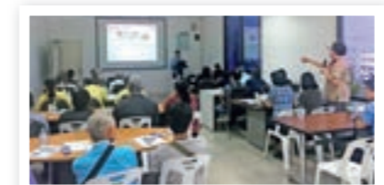
บรรยากาศการเยี่ยมชมโรงงาน

ณ โรงงานที่ปทุมธานี เรามุ่งมั่นที่จะพัฒนาการพูดคุยสื่อสารระหว่างองค์กรและผู้คนในท้องถิ่นให้ดียิ่งขึ้นด้วยการดำเนินกิจกรรมต่างๆ เช่น การเชิญผู้เกี่ยวข้องภาครัฐและผู้อยู่อาศัยในบริเวณรอบๆ เข้าเยี่ยมชมโรงงาน และการจัดให้มีการสอบถามความคิดเห็นเกี่ยวกับการดำเนินการด้านสีงแวดล้อม