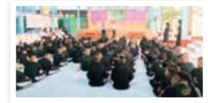
บรรยากาศของโรงเรียนประถม

เราได้มีการนำเอากล่องไม้ที่เป็นวัสดุเหลือทิ้งซึ่งเกิดขึ้นหลังจากที่มีการส่งชิ้นส่วนที่ใช้ในโรงงานเข้ามาในโรงงาน ไปทำเป็นโต๊ะและเก้าอี้ยาวที่ใช้ในโรงอาหารขึ้นภายในโรงงาน และบริจาคให้กับโรงเรียนประถมในบริเวณใกล้เคียง ในปี 2017 เราได้บริจาคโต๊ะไป 8 ตัว และเก้าอี้ยาว 16 ตัว